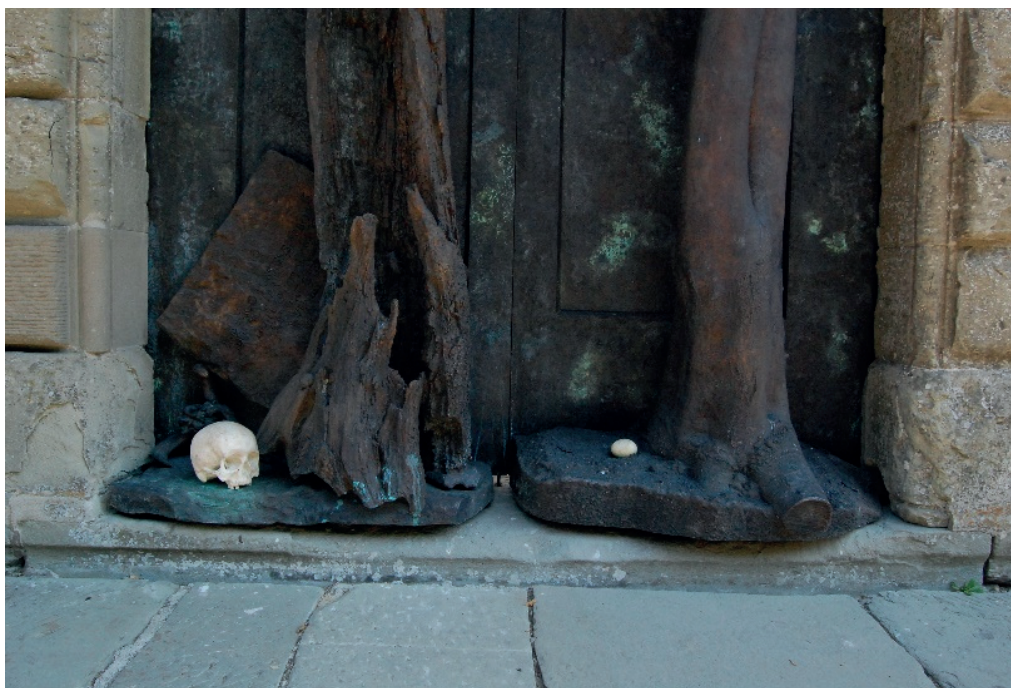
Particolare de La Porta Speciosa , di Claudio Parmiggiani, portale dell'eremo di Camaldoli.

Domenica 15 ottobre h 15,30 Casa santa Marcellina